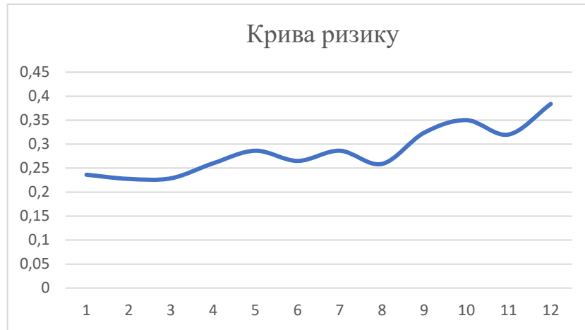
Рис. 1 – Крива економічного ризику

Основною метою побудови кривої ризику є прогнозування майбутнього ризику. Найоптимальніший прогноз буде тоді, коли економетрично правильно вибрана крива підгонки. Зазвичай в економетрії застосовують статистичні критерії (зокрема, критерій Фішера) для оцінки адекватності побудованої моделі, розраховують середню похибку апроксимації, коефіцієнт детермінації, можливо також порівняти варіації залишків (суми квадратів відхилень теоретичних значень від емпіричних). Пропонуємо скористатись можливостями табличного процесора MS EXCEL, а саме, вибравши діалогове вікно «Додавання лінії тренда», здійснити її форматування (рис.2).