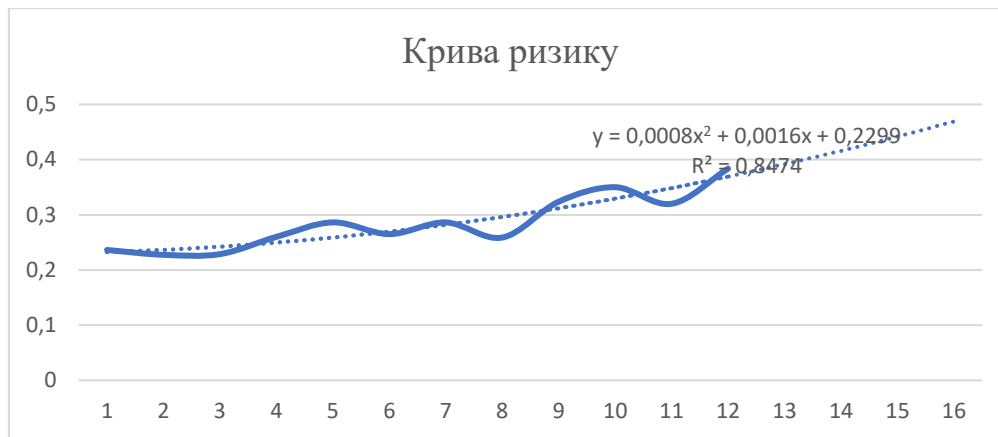
Рис. 3 – Прогнозування коефіцієнту ризику на основі кривої підгонки

і будуємо прогнозну криву ризику на 4 місяці вперед (рис. 3). За допомогою здійсненого прогнозу можна науково обґрунтовано стверджувати, яким буде коефіцієнт ризику на вказаний період.